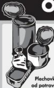
Plechovky od potravin