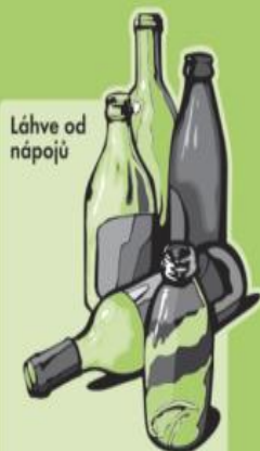
Láhve od nápojů