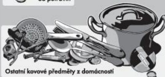
Ostatní kovové předměty z domácnosti

Nevhazujte obaly znečištěné zbytky potravin a nebezpečnými látkami!